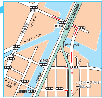
図1 芝浦からレインボーブリッジ一般道入口